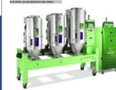
Granulattrockner MORETTO SX 205 A + 2 x 50l + 100 l Nr. 2121 Baujahr 2010 Luftmenge 200 m³/h Temperatur max. 150 °C Gebläseleistung 3 kW