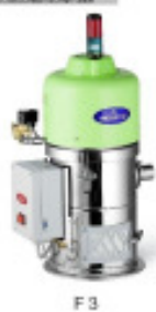
Granulatfördergerät MORETTO Einzelfoerdergeraet F3 F40 Nr. 2239 Baujahr 2011 Fördermenge bei 50 kg/h Förderschlauch 40 mm Gebläseleistung 1,0 kW