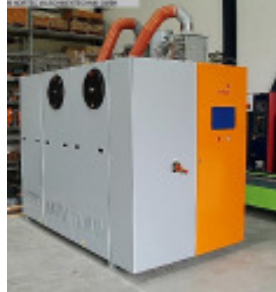
Granulattrockner MOTAN LUXOR A 2400 Nr. 2250 Baujahr 2007 Luftmenge 2.400 m³/h Durchsatz-Leist 1.120 kg/h Trocknungszeit 8-9 h