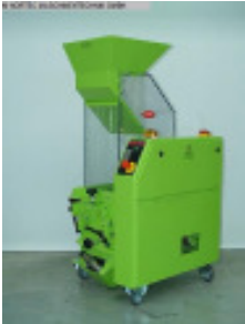
Schneidmühle MORETTO Zahnwalzenmuehle GRK 28 Nr. 2177 Baujahr 2012 Motorleistung 1,5 kW Einwurfgröße 449 x 386 mm Mahlkammergröße 242 x 270 mm