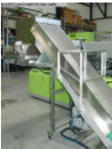
Winkel-Förderband ENGEL Winkelfoerderband Nr. 2260 Baujahr 2007 Förderlänge hor 2.000 mm Förderlänge ans 2.400 mm Gurtbreite 550 mm