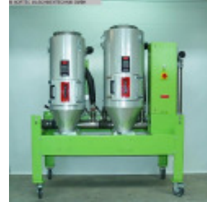
Granulattrockner MORETTO Trichtergestell 50 + 75l Nr. 2347 Baujahr 2011 Trockentrichter 50 + 75 l Temperatur max. 150 °C Gebläseleistung 1,5 je Zusatzheizung kW