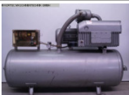
Druckluft- / Vakuumpumpe- / Thermoformmaschine BUSCH VAKUUMPUMPE 250-138 Nr. 1937 Baujahr Vakuumpumpe 20 mbar Leistung 250 m³/h Motorleistung 7,5 kW