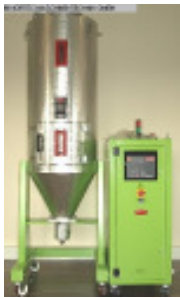
MORETTO Trockenlufttrockner SX 203 A Nr. 2317 Baujahr 2011 Luftmenge 100 m³/h Gebläseleistung 1,1 kW Molekularsieb 2 Stck/pices