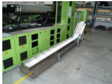
Winkel-Förderband ENGEL Winkelfoerderband Nr. 2267 Baujahr 2006 Gurtlänge 4500 mm Gurtbreite 400 mm Elektroanschluss 400/50 V / Hz.