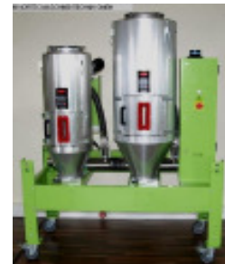
Granulattrockner MORETTO Trichtergestell 50l + 100 l Nr. 2345 Baujahr 2010 Trockentrichter 50 l + 100 l Gebläseleistung 1,5 kW