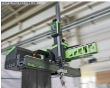
Linearroboter ENGEL VIPER 12 regular stand alone Nr. 2387 Baujahr 2012 X-Achse Entform 600 mm Y-Achse Vertika 1.200 mm Z-Achse Quertra 2.240 mm