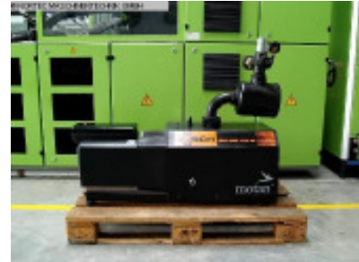
Vakuum/Druckluft Thermoformautomaten BUSCH MINK MM 1320 AV Nr. 2257 Baujahr 2007 Nennsaugvermöge 60 - 380 m 3 /h Enddruck 150 hPa (mbar) Motorleistung 7,5 kW