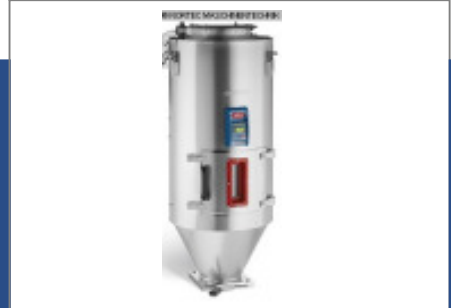
Granulatrockner MORETTO Isolierter Trichter TC 75 VP Nr. 2351 Baujahr 2010 Fassungsvermöge 75 l Isolierungsstär 40 mm Flanschdurchmes 50 mm