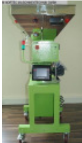
Granulateinfärbegerät MORETTO DGM 230 Gravimix Nr. 2157 Baujahr 2010 Dosierleistung 80 kg/h Durchsatzleistu 150 kg/h Masterbatch Vor 24 l