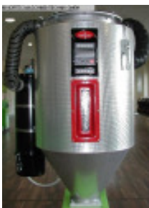
Granulattrockner MORETTO Heisslufttrockner EH1 A +T 30 Nr. 2329 Baujahr 2010 Luftmenge 35 m³/h Temperatur max. 50 - 140 °C Gebläseleistung 0,08 kW