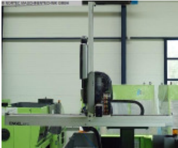
Linearroboter ENGEL ERC 13 F RC 200 Stand alone Nr. 2235 Baujahr 2011 X-Achse Entform 400 mm Y-Achse Vertika 1.000 mm Z-Achse Quertra 1.640 mm