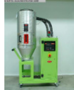
Granulatrockner MORETTO SX 201 A + TC75VP Nr. 2159 Baujahr 2010 Luftmenge 50 m³/h Gebläseleistung 0,4 kW Molekularsieb 2 Stck/ pices