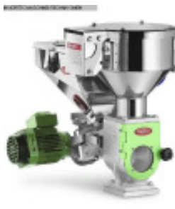
Granulateinfärbegerät MORETTO DVM 10 V Nr. 2307 Baujahr 2012 Dosierleistung 1,5 kg/h Durchsatzleistu 80 kg/h Masterbatch Vor 6 l