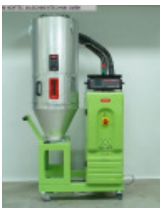
Granulattrockner MORETTO XD 21 A + TC100VP Nr. 2311 Baujahr 2010 Luftmenge 25-50 m³/h Gebläseleistung 0,4 kW Molekularsieb 2 Stck/ pices