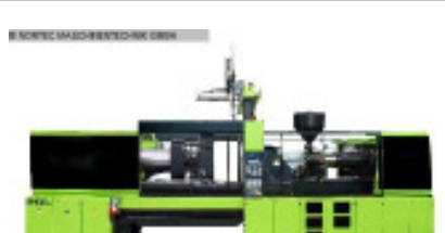
NORTEC - RENT machine pool

Spritzgiessmaschine bis 5000 KN ENGEL VC 750/160 Tech Nr. 80162 Baujahr 2012 Schneckendurchm 50 mm Spritzgewicht i 353 g/PS Schließkraft 1.600 kN