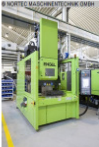
Spritzgiessmaschine vertikal ENGEL e-insert 310V/100 Nr. 2412 Baujahr 2010 Schneckendurchm 35 mm Spritzgewicht i 139 g/PS Schließkraft 1.000 kN