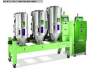
Granulattrockner MORETTO SX205 A + OTX 60, 80, 120 Nr. 2299 Baujahr 2011 Luftmenge 200 m³/h Temperatur max. 150 °C Gebläseleistung 3 kW