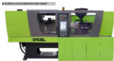
NORTEC - RENT machine pool

Spritzgiessmaschine bis 1000 KN ENGEL VC 330/80 Tech Nr. 80082 Baujahr 2012 Schneckendurchm 35 mm Spritzgewicht i 139 g/PS Schließkraft 800 kN