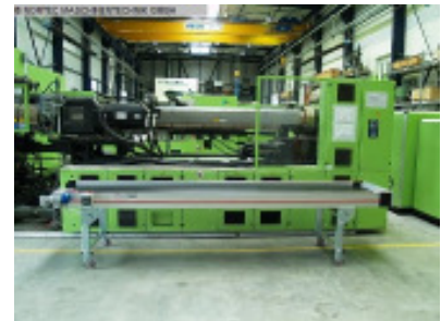
Horizontal-Förderband NORTEC Horizontalfoerderband 3000x600 Nr. 2427 Baujahr 2012 Gurtlänge 3000 mm Gurtbreite 550 mm Gesamtbreite 605 mm