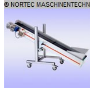
Winkel-Förderband NORTEC Steilfoerderband 1500x500 Nr. 2407 Baujahr 2012 Gurtlänge 1500 mm Gurtbreite 450 mm Gesamtbreite 505 mm