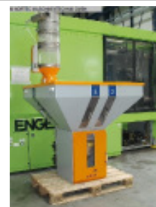
Granulateinfärbegerät MOTAN GRAVICOLOUR 1000 Nr. 2255 Baujahr 2007 Durchsatzleistu 1000 kg/h Anzahl der Komp 2-6 Stck/pieces Masterbatch Vor 60 / 120 l