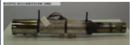
Zylinder ENGEL Massezylinder 30 mm Nr. 90601 Baujahr 1995 max. Hubvolumen 113 cm 3