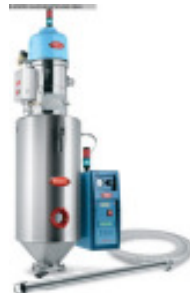
Granulattrockner MORETTO Drucklufttrockner Set D3TW Nr. 2287 Baujahr 2011 Luftmenge 6 - 17 m³/h Temperatur max. 180 °C Trockentrichter 30 l