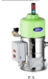
Granulatfördergerät MORETTO Einzelfoerdergeraet F3 F40 Nr. 2223 Baujahr 2011 Fördermenge bei 50 kg/h Förderschlauch 40 mm Gebläseleistung 1,0 kW