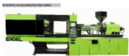
NORTEC - RENT machine pool

Spritzgiessmaschine bis 5000 KN ENGEL macPET II 4650/320 Nr. 2244 Baujahr 2008 Schneckendurchm 150 mm Spritzgewicht m 9.331 g Schließkraft 3.300 kN