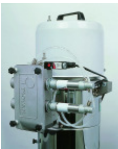
Granulatfördergerät PIOVAN VP 46 Nr. 1195 Baujahr 2006