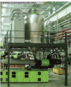
Granulattrockner MOTAN Trocknungstrichter 12.000 l Nr. 2252 Baujahr 2007 Volumen 12.000 l Durchmesser 2400 mm Gewicht ca. 2.400 kg