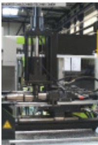
Schnecke und Zylinder komplett ENGEL HTV Stopfwerk 3.000 cm 3 Nr. 92012 Baujahr 2005 Schneckendurchm 18 mm max. Hubvolumen 25 cm 3