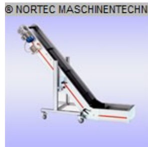
Winkel-Förderband NORTEC Winkelfoerderband 1300x500 Nr. 2408 Baujahr 2012 Gurtlänge 1300 mm Gurtbreite 450 mm Gesamtbreite 505 mm