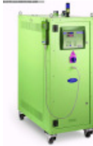
Granulattrockner MORETTO Trockenlufttrockner SX 203 A Nr. 2318 Baujahr 2011 Luftmenge 100 m³/h Gebläseleistung 1,1 kW Molekularsieb 2 Stck/ pices