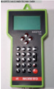
Granulatfördergerät MORETTO Fernbedienung Master 200 Nr. 2293 Baujahr 2011