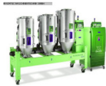
Granulattrockner MORETTO SX 203 A + OTX 60, 80, 120 Nr. 2296 Baujahr 2011 Luftmenge 100 m³/h Temperatur max. 150 °C Gebläseleistung 1,1 kW