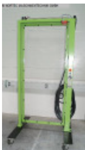
Ersatzteile ENGEL Drehtuer + Sicherheitspaket II Nr. 94006 Baujahr 2009 Türbreite max. 1000 mm Türhöhe 2100 mm Durchgang 850 mm