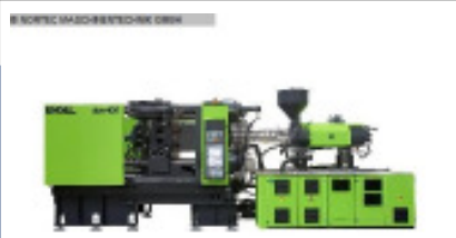
Liefertermin Mai 2012

Spritzgiessmaschine bis 5000 KN ENGEL VC 1350/200 Tech Nr. 2400 Baujahr 2007 Schneckendurchm 70 mm Spritzgewicht i 900 g/PS Schließkraft 2.000 kN