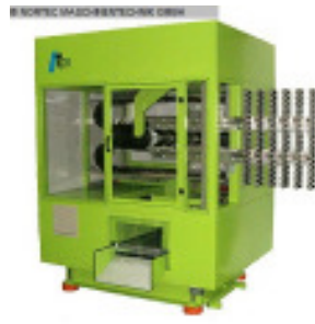
Entnahmeggerät TPS TPS Robot 4 Stage Nr. 2243 Baujahr 2008 Nachkühlstation 4 Stck/piece Anzahl Kavitäté 96 Stck/piece Preform-Gewicht 35 g/ PCO