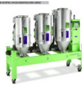
Granulatrockner MORETTO Trichtergestell 2 x 50l + 100l Nr. 2137 Baujahr 2010 Trockentrichter 2 x 50 l + 1 x 100 l Isolierungsstär 40 mm Gebläseleistung 1,5 pro Zusatzheizung kW