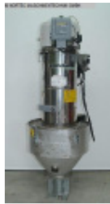
Granulatfördergerät PIOVAN C 10 L Materialabscheider Nr. 2165 Baujahr 2001 Fördervolumen 10 l Förderschlauch 50 mm erforderliche D 6 - 8 bar