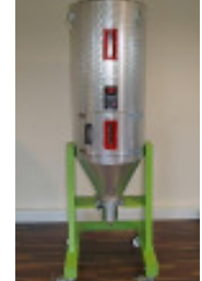
Granulatrockner MORETTO Trockentrichter 200 l isoliert Nr. 2175 Baujahr 2010 Trockentrichter 200 l Temperatur max. 200 °C Anschluss Ø 40 mm