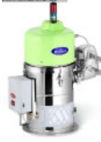
Granulatfördergerät MORETTO Einzelfoerdergeraet F5 F40 Nr. 2215 Baujahr 2011 Fördermenge bei 80 kg/h Förderschlauch 40 mm Gebläseleistung 1,0 kW