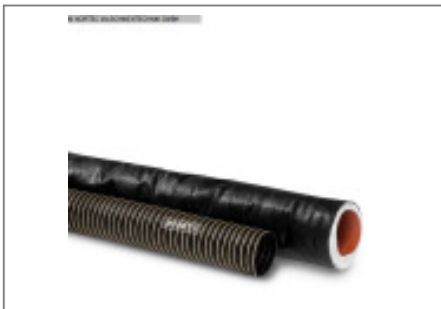
Granulatrockner MORETTO Luftschlauch isoliert TBC50L15 Nr. 2147 Baujahr 2010 Schlauchdurchme 50 mm Länge 1,5 m