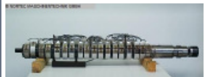
Schnecke und Zylinder komplett ENGEL Schnecke + Zylinder, komplett Nr. 90628 Baujahr 2000 Schneckendurchm 50 mm max. Hubvolumen 422 cm 3