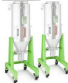
Granulatfördergerät MORETTO Trolley CMS 13 Nr. 2142 Baujahr 2010 Länge 556 mm Breite 494 mm Höhe 819 mm