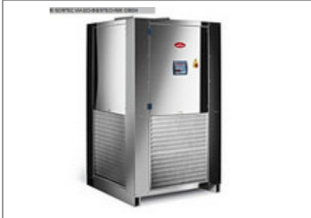
Kältemaschine MORETTO Kaeltemaschine RC 40 A Nr. 2333 Baujahr 2008 Nenn- Kälteleis 37,7 kW Antriebsleistun 6,1 + 2,2 kW