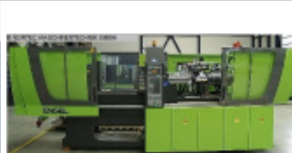
NORTEC - RENT machine pool

Spritzgiessmaschine bis 1000 KN ENGEL VC 200/50 Tech Nr. 80050 Baujahr 2012 Schneckendurchm 30 mm Spritzgewicht i 89 g/PS Schließkraft 500 kN