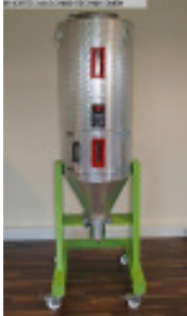
Granulatrockner MORETTO Trockentrichter 75 l isoliert Nr. 2349 Baujahr 2010 Trockentrichter 75 l Temperatur max. 200 °C Anschluss Ø 40 mm