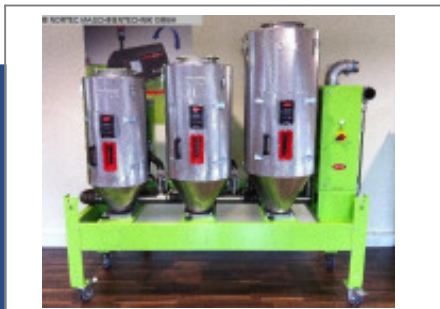
Granulatrockner MORETTO Trichtergestell OTX 60,80,120 Nr. 2138 Baujahr 2011 Trockentrichter 1 x 60, 1 x 80, 1 x 120 l Isolierungsstär 40 mm Gebläseleistung 1,5 pro Heizung kW