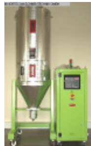
Granulatrockner MORETTO SX 202 A + 200 Ltr Trichter Nr. 2089 Baujahr 2010 Luftmenge 70 m³/h Gebläseleistung 0,8 kW Molekularsieb 2 Stck/ pices