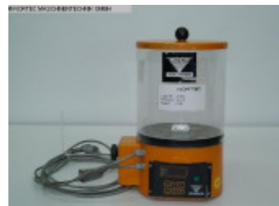
Granulateinfärbegerät KOCH Dosiergeraet KEM Nr. 20298 Baujahr 1999 Durchsatzleistu bis 200 kg/h Masterbatch Vor ca. 5 l