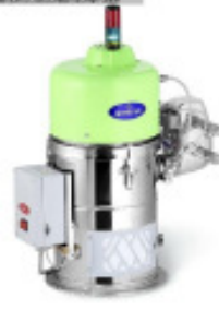
Granulatfördergerät MORETTO Einzelfoerdergeraet F5 F40 Nr. 2213 Baujahr 2011 Fördermenge bei 80 kg/h Förderschlauch 40 mm Gebläseleistung 1,0 kW