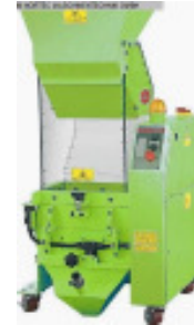
Schneidmühle MORETTO Knabermuehle GRK 38 A Nr. 2316 Baujahr 2011 Motorleistung 2,2 kW Mahlkammergröße 242 x 366 mm