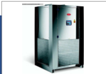
Kältemaschine MORETTO Kaeltemaschine RC 40 A Nr. 2463 Baujahr 2012 Nenn- Kälteleis 37,7 kW Antriebsleistun 6,1 kW