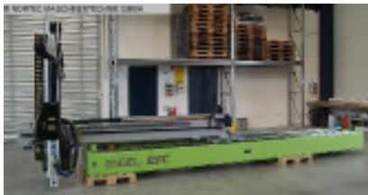
Linearroboter ENGEL ERC 96/0-F Nr. 2021 Baujahr 2005 X-Achse Entform 2.100 mm Y-Achse Vertika 1.500 + 1.500 mm Z-Achse Quertra 4.880 mm