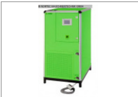
Kältemaschine EISBAER Dry Air System DAS 120 Nr. 2247 Baujahr 2003 Luftmenge 1.800 m³/h Taupunkt der Tr -30 °C Kühlwassertempe 0-10 °C