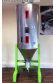
Granulatrockner MORETTO Trockentrichter OTX 180 Nr. 2341 Baujahr 2011 Luftmenge 100 m³/h Temperatur max. 150 °C Trockentrichter 180 l