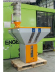
Granulateinfärbegerät MOTAN GRAVICOLOUR 1000 Nr. 2256 Baujahr 2007 Durchsatzleistu 1000 kg/h