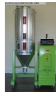
Granulattrockner MORETTO XD23 + OTX 180 Nr. 2297 Baujahr 2011 Luftmenge 45-100 m³/h Temperatur max. 150 °C Trockentrichter 180 l