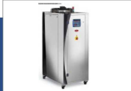
Kältemaschine MORETTO Kaeltemaschine RC 30 A Nr. 2461 Baujahr 2012 Nenn- Kälteleis 32,7 kW Antriebsleistun 6,5 + 0,8 kW