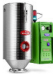
Granulatrockner MORETTO Drucklufttrockner D2 TW Nr. 2319 Baujahr 2011 Luftmenge 3-10 m³/h Temperatur max. 180 °C Trockentrichter 15 l