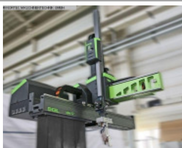
Linearroboter ENGEL VIPER 12 regular stand alone Nr. 2385 Baujahr 2012 X-Achse Entform 600 mm Y-Achse Vertika 1.200 mm Z-Achse Quertra 2.240 mm