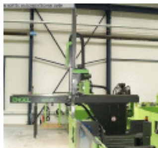
Linearroboter ENGEL VIPER 20 regular stand alone Nr. 2401 Baujahr 2012 X-Achse Entform 700 mm Y-Achse Vertika 1.300 mm Z-Achse Quertra 2.360 mm