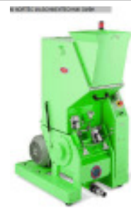
Schneidmühle MORETTO Universalmuehle GRV 20/30 Nr. 2313 Baujahr 2011 Motorleistung 3 kW Einwurfgröße 370 x 300 mm Mahlkammergröße 300 x 215 mm