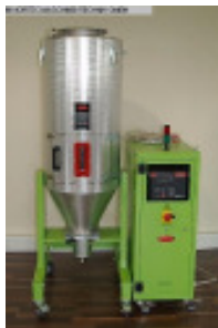
Granulattrockner MORETTO SX 203 A + OTX 180 Nr. 2294 Baujahr 2011 Luftmenge 100 m³/h Temperatur max. 150 °C Trockentrichter 180 l