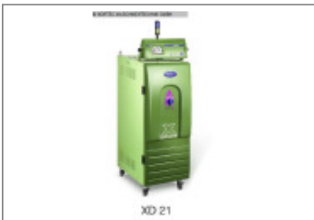
Granulatrockner MORETTO Trockenlufttrockner XD 21 A Nr. 2111 Baujahr 2010 Luftmenge 50 m³/h Gebläseleistung 0,4 kW Molekularsieb 2 Stck/ pices