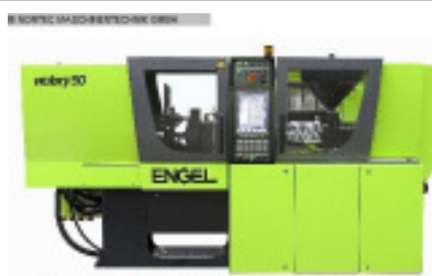
NORTEC - RENT machine pool

Spritzgiessmaschine bis 5000 KN ENGEL VC 1050/220 Tech Nr. 80222 Baujahr 2012 Schneckendurchm 55 mm Spritzgewicht i 459 g/PS Schließkraft 2.200 kN