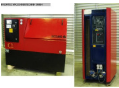
Kompressor und Druckluftaufbereitung ECOAIR ECOAIR C 50-10-SS Nr. 1743 Baujahr 1989 Volumenstrom 4,95 m 3 /min Verdichtungsdruck 10 bar Motorleistung 37 kW