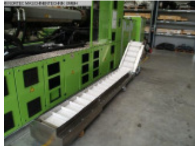
Winkel-Förderband ENGEL Winkelfoerderband Nr. 2268 Baujahr 2005 Gurtlänge 4800 mm Gurtbreite 457 mm Elektroanschluss 400/50 V / Hz.