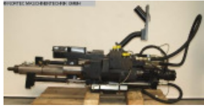
Schnecke und Zylinder komplett ENGEL Spritzaggregat ES 200/... Nr. 92030 Baujahr 2003 Schneckendurchm 30 mm max. Hubvolumen 99 cm 3