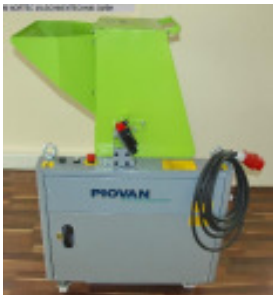
Schneidmühle PIOVAN RSP 1530 Nr. 1412 Baujahr 2007 Motorleistung 4 kW Mahlkammergröße 150 x 300 mm Raumbedarf ca. 608 x 658 x 1045 mm