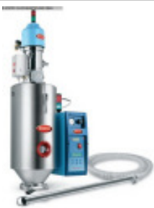
Granulattrockner MORETTO Drucklufttrockner Set D2TW Nr. 2283 Baujahr 2011 Luftmenge 3 - 10 m³/h Temperatur max. 180 °C Trockentrichter 15 l