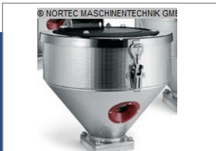
Granulatrockner MORETTO Maschinentrichter DHM 5 Nr. 2150 Baujahr 2012 Fassungsvermöge 5 l Isolierungsstär 40 mm Flanschdurchmes 120 x 120 mm