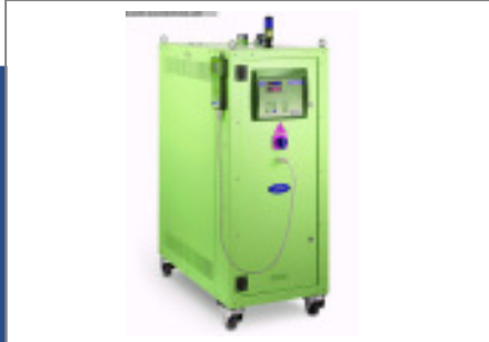
Granulatrockner MORETTO Trockenlufttrockner SX 202 A Nr. 2109 Baujahr 2010 Luftmenge 70 m³/h Gebläseleistung 0,8 kW Molekularsieb 2 Stck/ pices