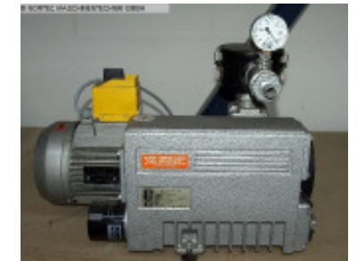
Vakuum/Druckluft Thermoformautomaten BUSCH Vakuumpumpe R5 Nr. 2079 Baujahr 2003 Nennsaugvermöge 25 m 3 /h Enddruck 0,1 hPa (mbar) Motorleistung 0,75 kW