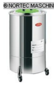
Granulattrockner MORETTO Lagerbehälter 100 Ltr. Nr. 2269 Baujahr 2011 Volumen 100 l Durchmesser 505 mm Höhe 866 mm