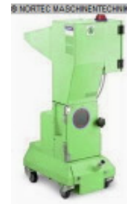
Schneidmühle MORETTO Universalmuehle GR 18/10 M1 A Nr. 2321 Baujahr 2011 Motorleistung 1,1 kW Einwurfgröße 190 x 150 mm Mahlkammergröße 190 x 150 mm