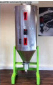
Granulatrockner MORETTO Trockentrichter OTX 240 Nr. 2343 Baujahr 2011 Trockentrichter 240 l Isolierungsstär 40 mm Temperatur max. 150 °C