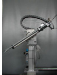
Linearroboter ASS AEA-SIL 400 Nr. 2359 Baujahr 2005 Vertikalhub Y p 400 mm Entformhub X 80 mm