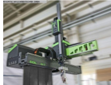
Linearroboter ENGEL VIPER 12 regular stand alone Nr. 2388 Baujahr 2012 X-Achse Entform 600 mm Y-Achse Vertika 1.200 mm Z-Achse Quertra 2.240 mm