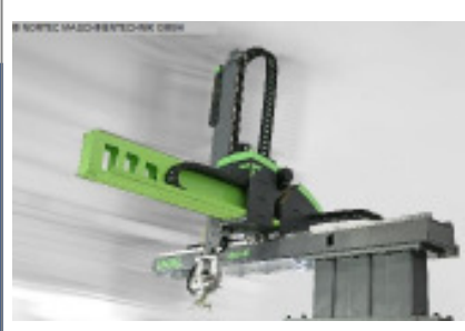
Linearroboter ENGEL VIPER 40 regular stand alone Nr. 2425 Baujahr 2012 X-Achse Entform 700 mm Y-Achse Vertika 800 + 800 mm Z-Achse Quertra 2.360 mm