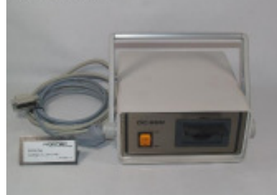
Ersatzteile ENGEL Kassettengerät-Emulator DC 882 Nr. 93007 Baujahr neuwertig Anschlußspannun 220 V