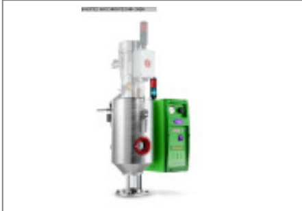
Granulatrockner MORETTO Drucklufttrockner D1 TW Nr. 2158 Baujahr 2010 Luftmenge 1-5 m³/h Temperatur max. 180 °C Trockentrichter 6 l