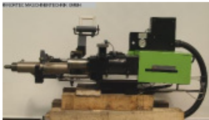
Schnecke und Zylinder komplett ENGEL Spritzaggregat ES 200/... Nr. 92029 Baujahr 2003 Schneckendurchm 30 mm Hubvolumen max. 99 cm 3