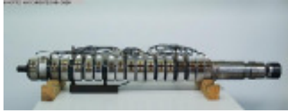
Schnecke und Zylinder komplett ENGEL Schnecke + Zylinder, komplett Nr. 90629 Baujahr 2000 Schneckendurchm 50 mm max. Hubvolumen 422 cm 3