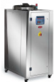
Kältemaschine MORETTO Kaeltemaschine RC 15 A Nr. 2459 Baujahr 2012 Nenn- Kälteleis 15,1 kW Antriebsleistun 3,5 + 0,8 kW