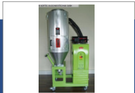
Granulatrockner MORETTO XD 21 A + TC50VP Nr. 2153 Baujahr 2010 Luftmenge 25-50 m³/h Gebläseleistung 0,4 kW Molekularsieb 2 Stck/ pices