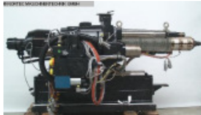
Schnecke und Zylinder komplett ENGEL Spritzaggregat ES 330/... Nr. 92018 Baujahr 1998 Schneckendurchm 45 mm max. Hubvolumen 318 cm 3