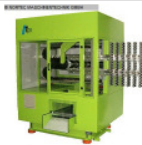
Entnahmeggerät TPS TPS Robot 4 Stage Nr. 2245 Baujahr 2008 Nachkühlstation 4 Stck/piece Anzahl Kavitäté 96 Stck/piece Preform-Gewicht 35 g/ PCO