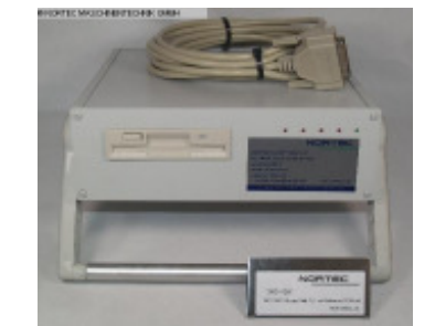
Ersatzteile NORTEC Floppy Disk 3,5" extern Nr. 93006 Baujahr 2011 Floppy Disk 3,5 Zoll Anschlußspannun 220 V