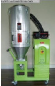
Granulattrockner MORETTO XD 21 A + TC75VP Nr. 2152 Baujahr 2010 Luftmenge 25-50 m³/h Gebläseleistung 0,4 kW Molekularsieb 2 Stck/ pices