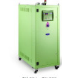
Granulatrockner MORETTO Trockenlufttrockner SX 205 A Nr. 2108 Baujahr 2011 Luftmenge 200 m³/h Gebläseleistung 3 kW Molekularsieb 2 Stck/ pices