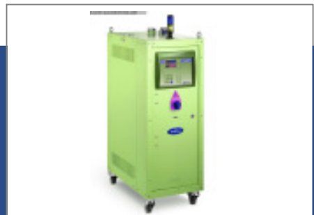
Granulatrockner MORETTO Trockenlufttrockner SX 201 A Nr. 2110 Baujahr 2010 Luftmenge 50 m³/h Gebläseleistung 0,4 kW Molekularsieb 2 Stck/ pices