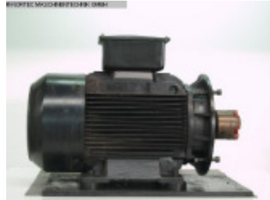
Ersatzteile ENGEL Elektromotor Nr. 93012 Baujahr 2003 Antriebsleistun 22 kW