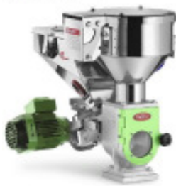
Granulateinfärbegerät MORETTO DVM 14 V Nr. 2227 Baujahr 2012 Dosierleistung 3,5 kg/h Durchsatzleistu 80 kg/h Masterbatch Vor 6 l